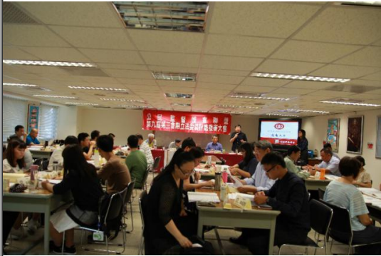
第九屆第三會期複審大會 (圖一) 地方議會串聯會議(圖二)

院的議事規則與流程，我們也積極籌劃製作桌遊；爲了推廣立委監督，公督盟也積極推展到校園或各大組織的巡迴講座；更重要的是，2018年將迎來激烈的地方父母官以及地方議員的選舉，許多中央立委也地方議員開始磨練與養成，故如何選出清廉、專業、理性、善於溝通的地方議員，也攸關著臺灣未來的治版圖，所以公督盟已開始與各地的議會的監督團體串聯，希望打造地方監督團體串流平台，一同監督法的分享、活動串聯、近一步打造開放的議會、人民的議會。